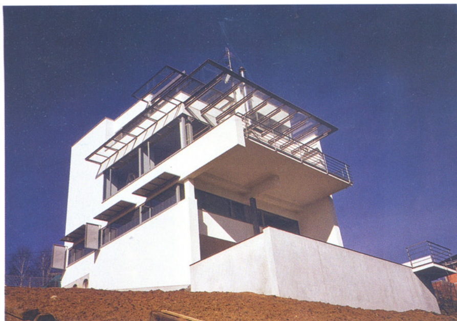
Vila na Pantovčaku 267